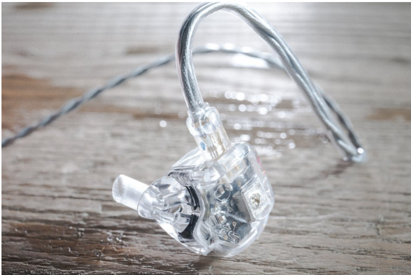
導管經過重新改良，能夠適度進入耳仔更貼近耳窩。