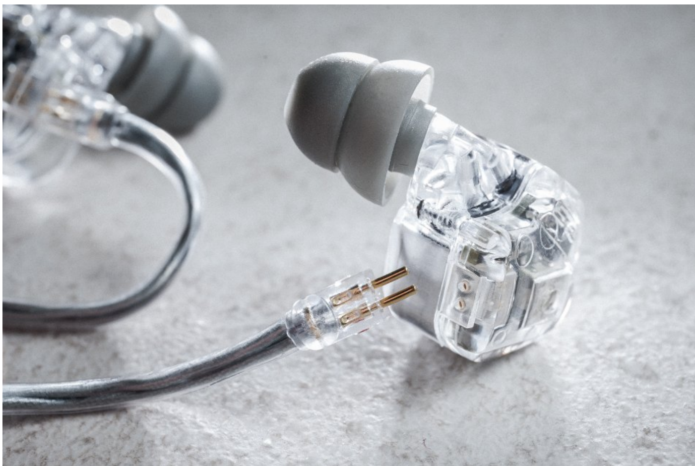
可換線設計，採用 CM 耳機的兩針插頭。